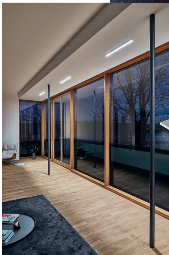
Occhio: Mito linear vereint Wohn- und Arbeitswelten mit minimalistischer Eleganz und höchster Innovation. www.occhio.ch