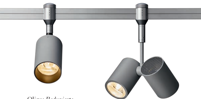
Oligo: Reduzierte Formsprache, kleine Bauform und überzeu- gende Lichtleistung zeichnen den kompakten Strahler «Walley» aus. www.oligo.ch

Neuste LED- und Automationstechnologie bringen die aktuellen Leuchten zum Strahlen.