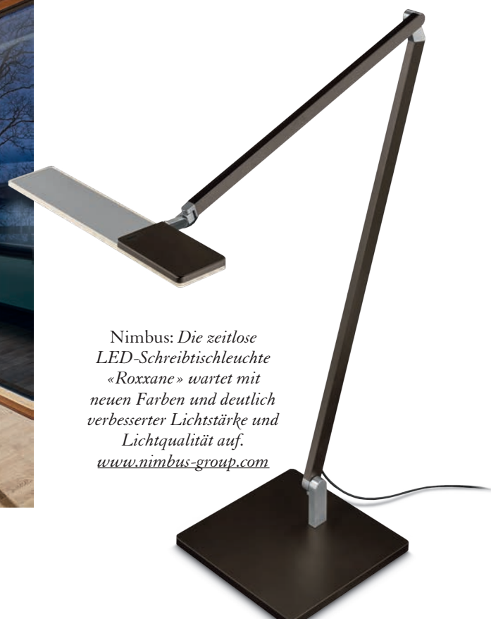
Nimbus: Die zeitlose LED-Schreibtischleuchte «Roxxane» wartet mit neuen Farben und deutlich verbesselter Lichtstärke und Lichtqualität auf. www.nimbus-group.com