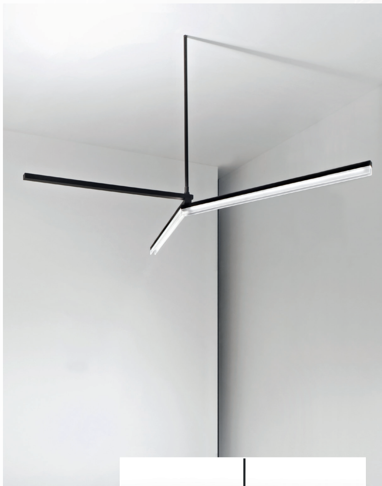
“3F Trittico” (design: Atelier(s) Alfonso Femia, per 3F Filippi)

La luce di “3F Trittico” è una luce a geometria variabile, tale da offrire la massima flessibilità di utilizzo all'interno di un ambiente