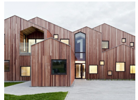
CHILDREN'S HOME OF THE FUTURE di Studio CEBRA, Danimarca - Kerteminde