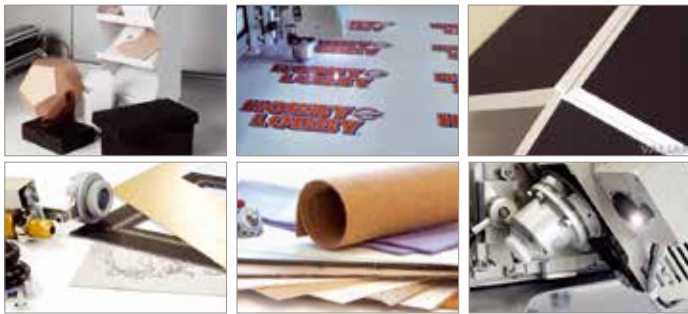
Esempi di realizzazioni con plotter Valiani

Dotato di un esclusivo sistema di teste intercambiabili garantisce massima produttività e precisione per tutti i tipi di lavorazione (taglio, cordonatura, disegno e decore) e per la realizzazione di scatole, espositori, adesivi, prototipi e mock-up.