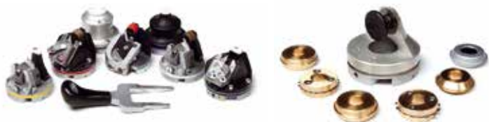
Vasta gamma di utensili intercambiabili.